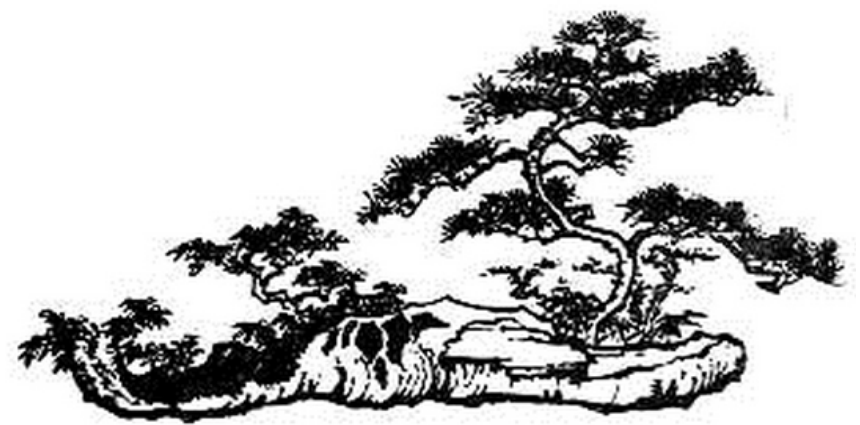
钟乳石 黑松 (早盆)